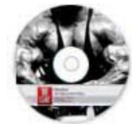
CD 1 Guía de trabajo y examen final